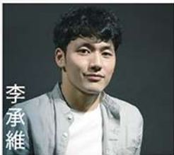
國立臺灣體育運動大學舞蹈系畢業