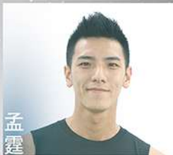
國立臺北藝術大學舞蹈學系畢業、文化舞蹈節舞者