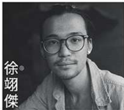
國立台北藝術大學舞蹈系畢業