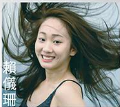
國立臺北藝術大學舞蹈系畢業